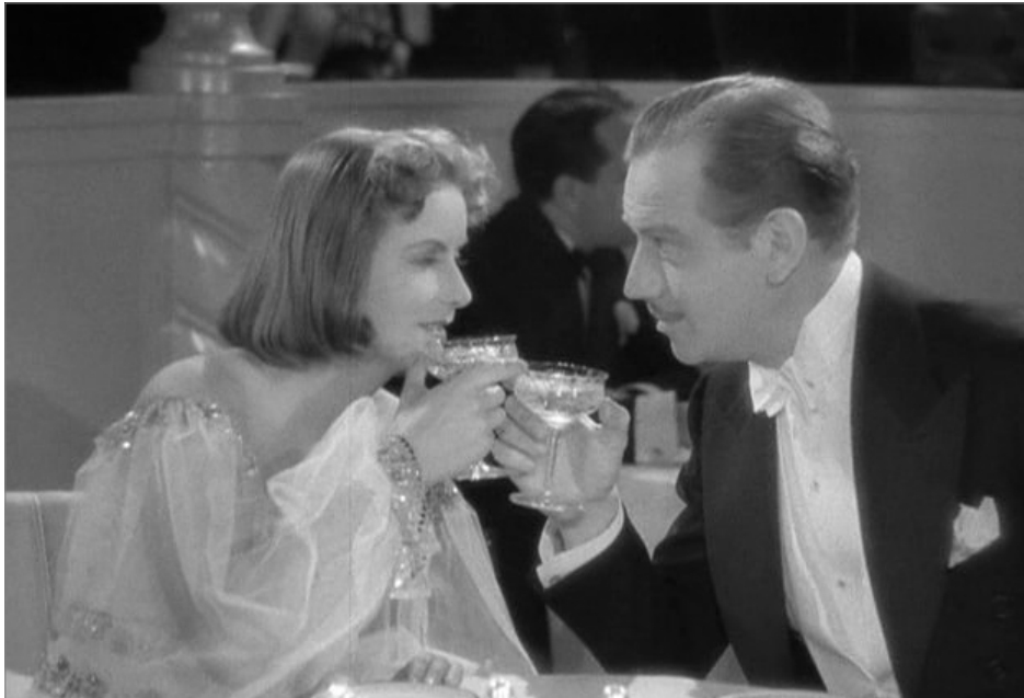
Ninotchka , 1939

« Du seul point de vue du style, je pense n'avoir rien fait de meilleur, ou d'aussi bon, que Haute pègre » Ernst Lubitsch