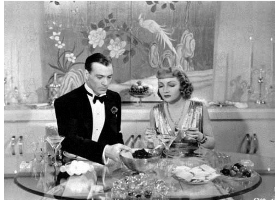
La Huitième femme de Barbe bleue , 1938