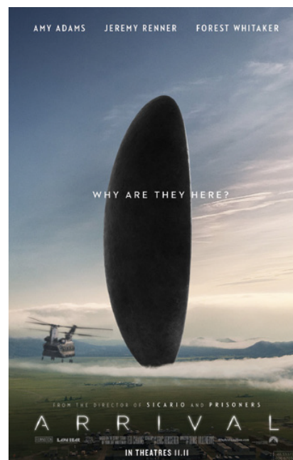
Affiche américaine et canadienne